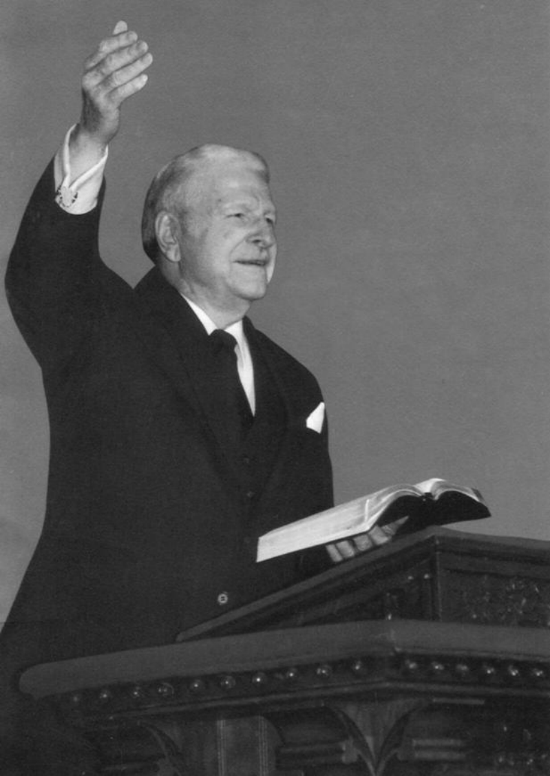
Dr. W.A. Criswell 1909-2002